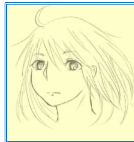
イラストは チャンドラさんからです

ひょんなことから、76歳の祖母のつきそいで、夜間中学へ通うことになった優菜。そこで出会った仲間たちとのかけがえのない日々…。どうして勉強するのか、なぜ学校へ行くのか。多感な中学生の目を通して描く。