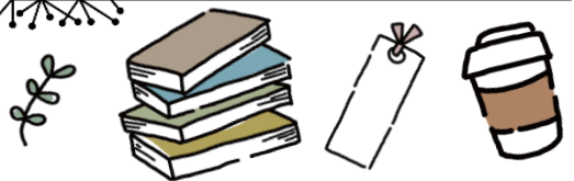
2015年度「秋の夜長にしみじみと味わって読みたい大人の小説」展示 →

2020年度の展示では、職員から集めた「おすすめコメント」をしおりにして展示しておりました。しおりも本と一緒に借りることができ、おすすめコメントを読みながら、より読書を楽しめるような展示になっていました。