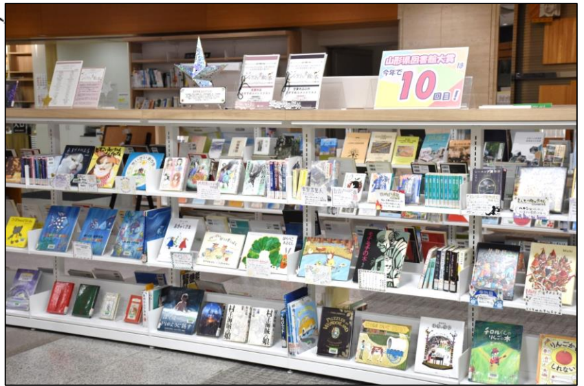
↑2024年度 「ジャケットが素敵な本」展示

毎年10月頃、図書館大賞作品の発表の時期には、受賞作品やノミネート作品、その他関連本を展示しています。本だけではなく、県内図書館職員から寄せ集めた「おすすめコメント」もご紹介。「この本のココが好き」と言った、職員の本に対するアツい思いが込められています！今年の展示では、受賞作品のおすすめコメントを手描きPOPで掲示！素敵なジャケットも相まってパッと見て楽しい、鮮やかな展示となりました。受賞作品は毎年異なりますので、「今年の受賞作は何か？」と楽しみにしていただけると嬉しいです。また、県立図書館だけでなく、県内公共図書館や学校図書館でも図書館大賞の展示を行っているところもございます。ぜひお近くの図書館を覗いてみてくださいね。